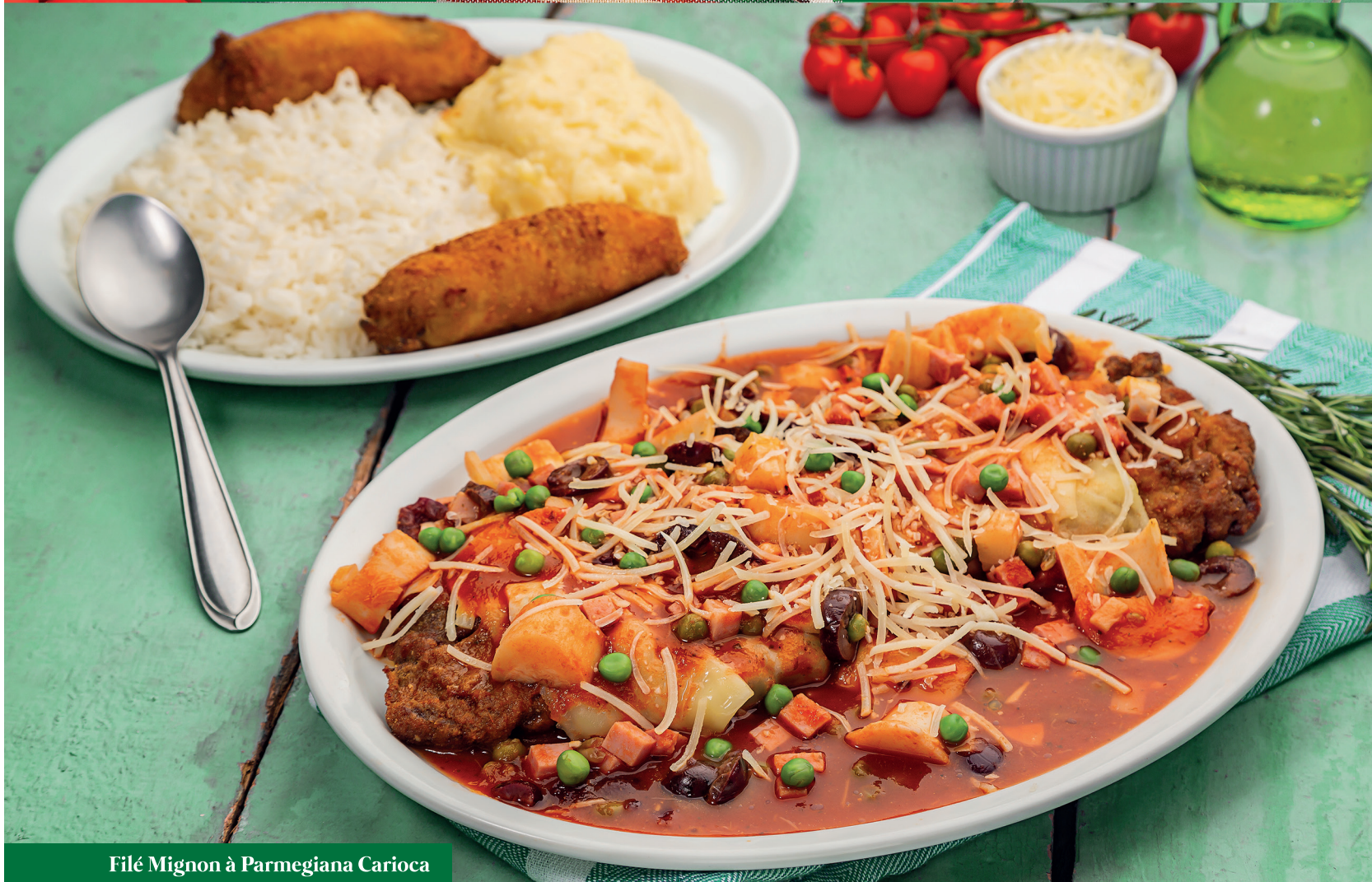
Filé Mignon à Parmegiana Carioca