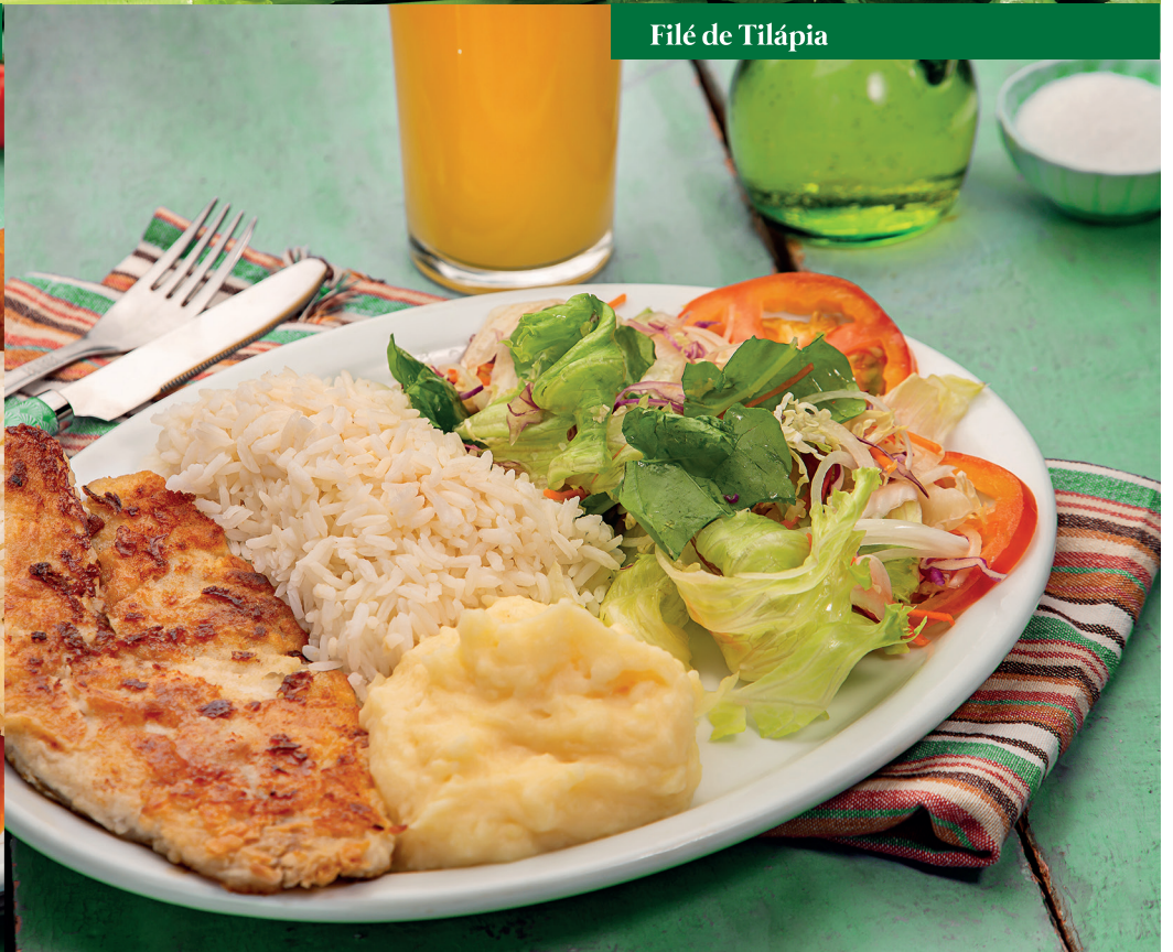
Filé de Tilápia