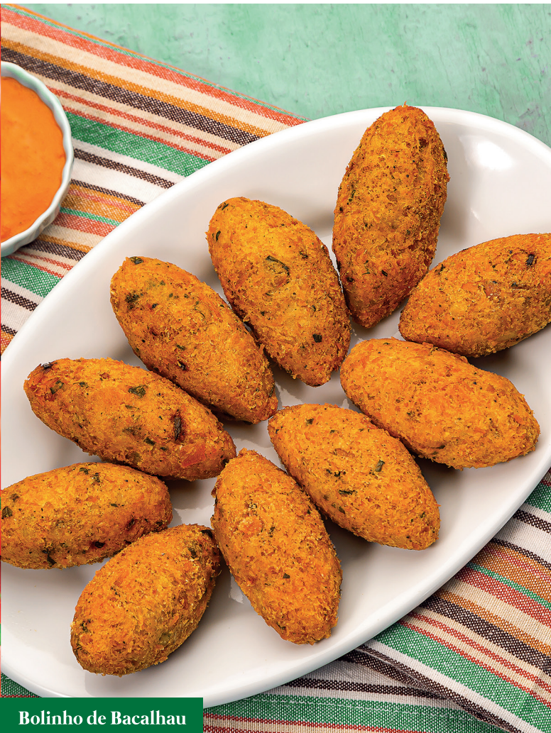
Bolinho de Bacalhau